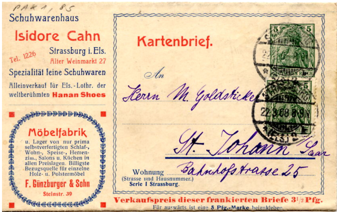
Doc 1 : carte-lettre publicitaire présentée avec un timbre de 5 Pfg pré-imprimé permettant l'envoi d'une lettre avec un message pour la ville de Strasbourg. L'ajout d'un second timbre de 5 Pfg est dû au fait que le courrier était destiné à une personne habitant à St. JOHANN à l'extérieur de Strasbourg.