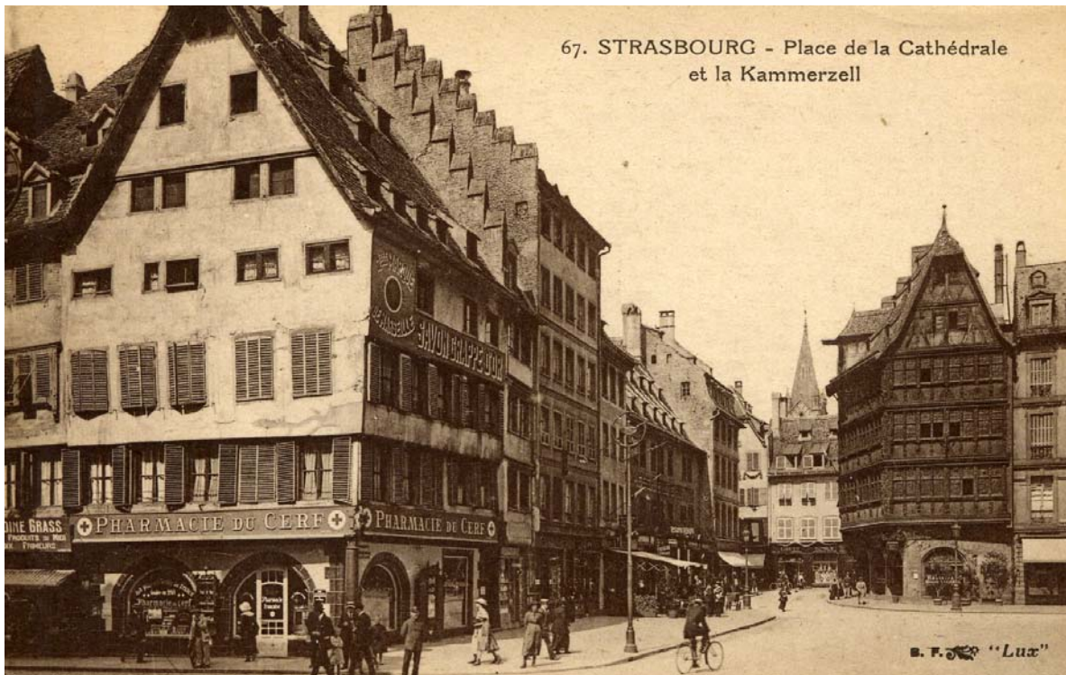
Doc 7 : vue de la carte postale de la « Hirsch Apotheke » – Pharmacie du Cerf de Strasbourg la plus ancienne pharmacie fondée en 1268,

Une preuve complémentaire de cette notoriété est donnée par le graphisme de cartes postales de la Pharmacie du Cerf (Doc 7 et 9) et la situation du local de la pharmacie en face de la cathédrale de Strasbourg.