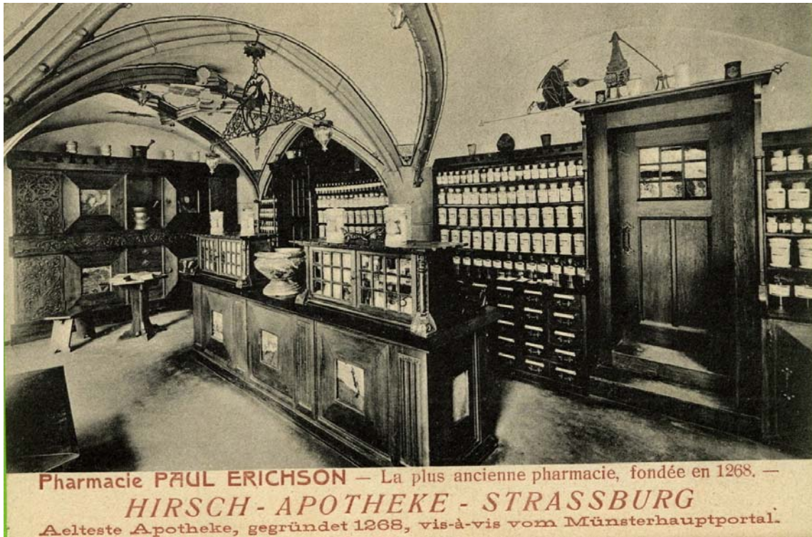
Doc 9 : carte postale avec vue de l'intérieur de la « Hirsch Apotheke » – Pharmacie du Cerf de Strasbourg, la plus ancienne pharmacie fondée en 1268, vis-à-vis « vom Münsterhauptportal », porte principale de la cathédrale de Strasbourg

Vu la notoriété de cette pharmacie, différents personnages y ont séjourné : en 1732-1733, Andreas Sigismund MARGGRAF, qui mit en évidence l'existence de sucre dans les betteraves, Wolfgang GOETHE, Inscrit en 1770 à l'Université de Strasbourg et aux cours de chimie de SPIELMANN apothicaire à la Pharmacie du Cerf et rédacteur de la Pharmacopée de Strasbourg « Pharmacopoea generalis, Argentorati 1783 » (3) (Doc 10). Emanuel MERCK, fondateur de la Société d'alcaloïdes MERCK de Darmstadt, fréquenta en 1813-1814 cette officine.