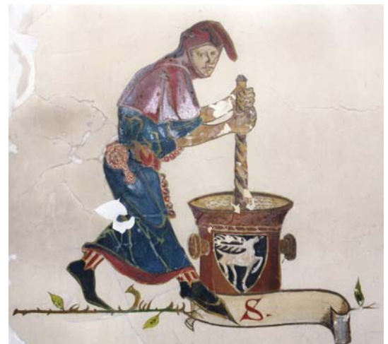
« mortier avec le cerf »