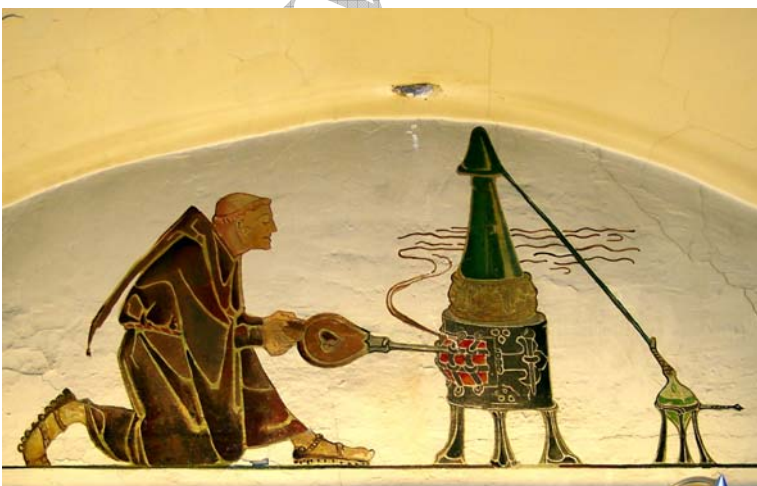
Doc 8 : pharmacie décorée par des peintures murales de l'illustrateur Léo SCHNUG « ensemble de distillation »

L'intérieur de la pharmacie avait été décoré par l'illustrateur strasbourgeois très connu Léo SCHNUG au moyen de peintures murales et de décorations en fer forgé. (Doc 8 et 9).