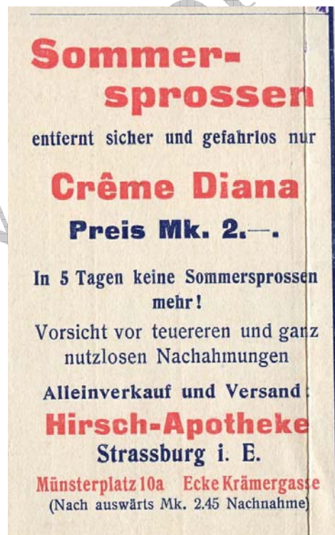
Doc 2 Une publicité pour le médicament « Crème Diana » de la Pharmacie du Cerf de Strasbourg (Hirsch-Apotheke i. E.) figure à l'intérieur de la carte-lettre dont le message est :

« Les taches de rousseur sont éliminées sûrement et sans effets néfastes en 5 jours grâce à la Crème Diana – Prix de 2 mark –. Veuillez vous méfier de copies plus onéreuses et inefficaces. Le seul vendeur et expéditeur est la Pharmacie du Cerf de Strasbourg en Alsace – place de la cathédrale 10a et au coin de la rue Mercière. (Pour l'étranger et en recommandé : 2,45 mark).